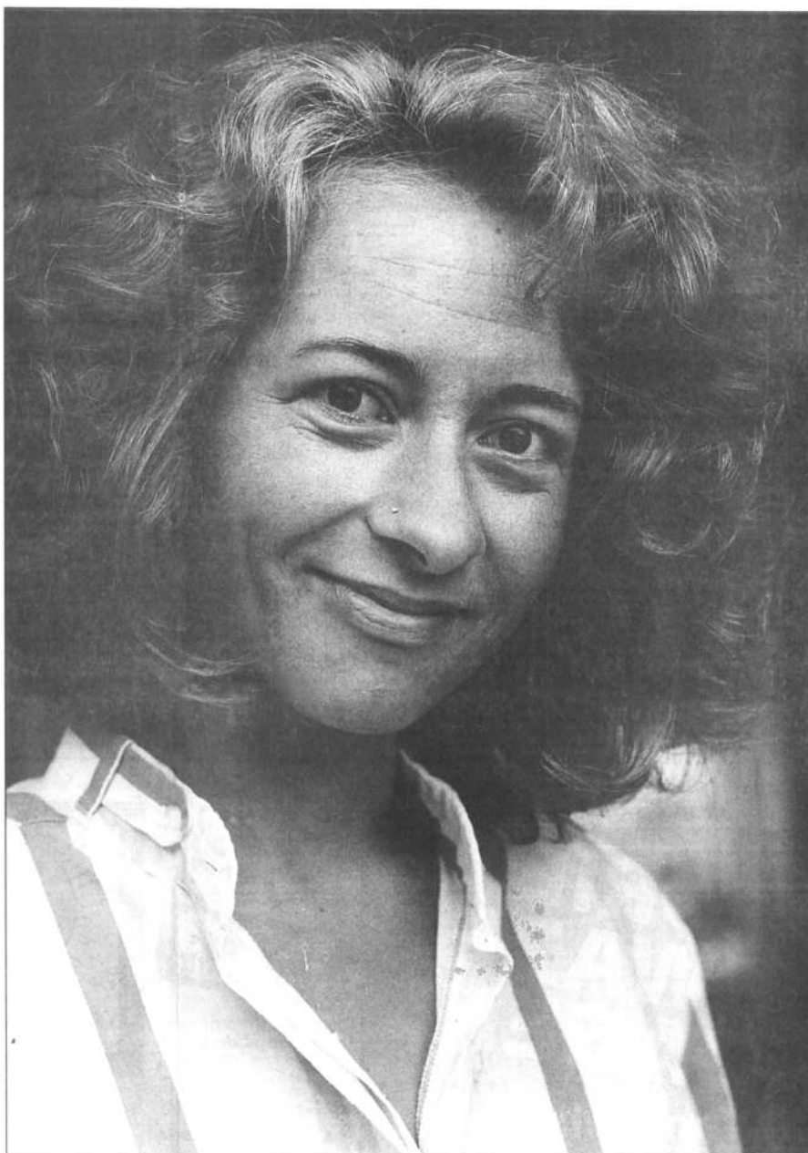
„Ik hoop dat ik erin zal slagen dat mensen zich vertrouwd bij mij voelen”

Ze zet haar tweede flesje pils aan haar lippen als het gesprek komt op uiterlijkheden en de representatieve kant van haar predikant zijn. Trouwen of samenwonen valt daar